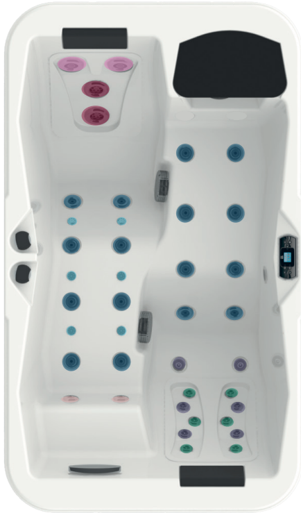
Diamètre et positionnement des buses