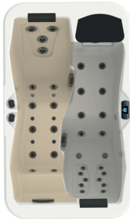
Zone de câblage